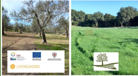
Fig. 1. Multifunctional olive grove system located in Sassari, North-West Sardinia (IT)

Italy - Sardinia, forage seed mixtures for olive systems and grazed woodlands